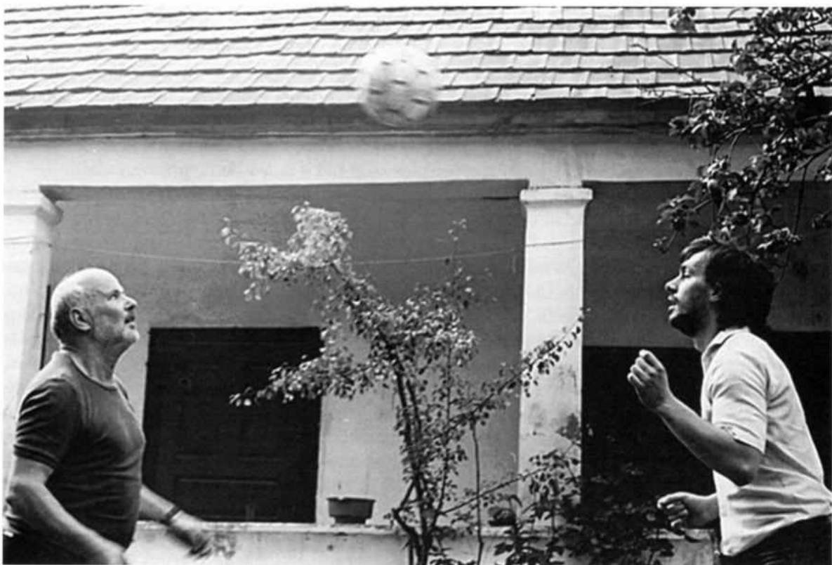
Eörsi István és Orbán Viktor, Perőcsény, 1989 június vége.

Nem szép versek írására törekedett, mert úgy tartotta, „hitelt, rangot, súlyt valamely költészethez csak a személyiség ereje adhat”, mert a szó-mágia nem segít a gondolatszegénységben. Nála nem az a fontos, hogy „hogyan?”, hanem az, hogy „miért?”. Eörsire hatott a beat- és a jazz-korszak szellemisége, világa, és hatott rá Ginsberg amorfi formavilága. Izgalomban tartotta a változást, miután már az előrelátás kiment a divatból. Műveinek élményforrása rokon a beat-nemzedék „úton-szellemével”. Néha bohém alakként jelenik meg, és királylányt kísér haza egy csehóból, akinek egész nap rossz dolga volt, boldog-boldogtalan fogdosta, és nem véletlen hogy a vers végé-